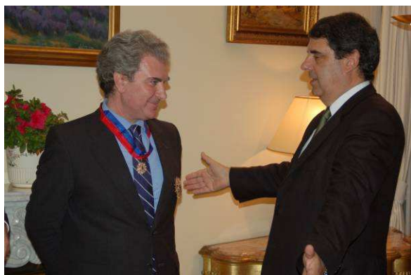
Gonzalo Martner saluda a Cesar Antonio Molina, luego de imponerle la Condecoración.

Molina, que reconoció la brillantez de la poesía, no sólo de Pablo Neruda, Vicente Huidobro y Gabriela Mistral, sino además la de Jorge Tellier y Gonzalo Rojas, afirmó que “con Nicanor Parra los españoles tenemos una gran deuda pues no hemos sabido premiar aún con el Cervantes a uno de los más grandes poetas hispanoamericanos del siglo XX”.